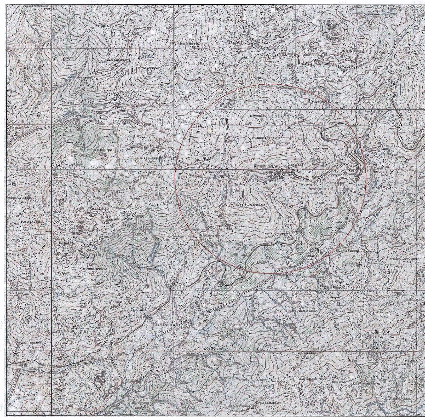
Starcio IGM 25:000 - Foglio 443090 - Bortigiadas