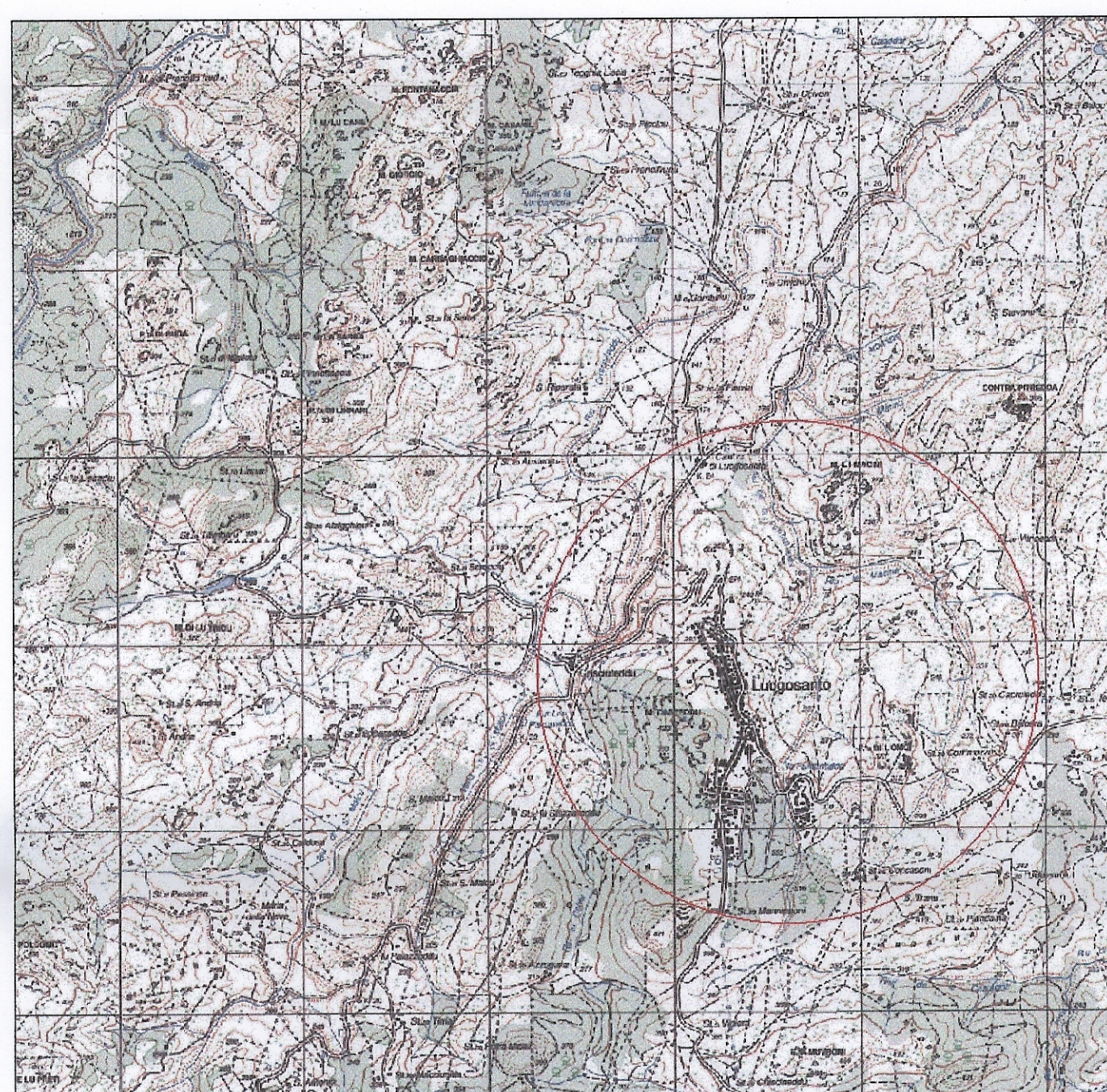
Stralcio IGM 25:000 - Foglio 427110 Luogosanto