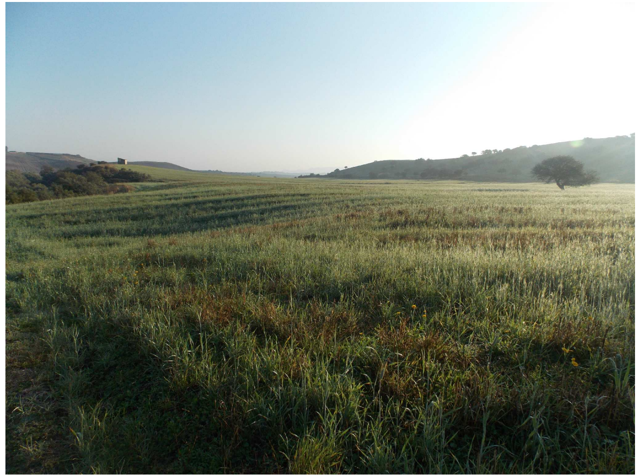
Tavola n. 4.1 Tipologie ambientali scala 1:10.000 giugno 2019