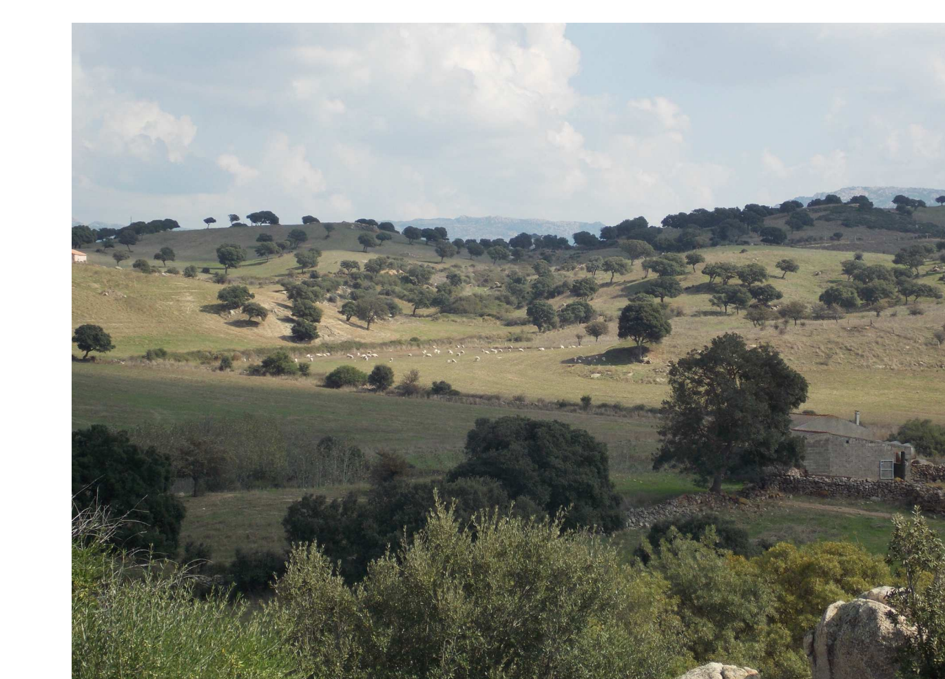
Tavola n. 4.2 Effetti di impatto scala 1:10.000 giugno 2019

RTI CRITERIA Dott. Agronomo Vincenzo Sechi