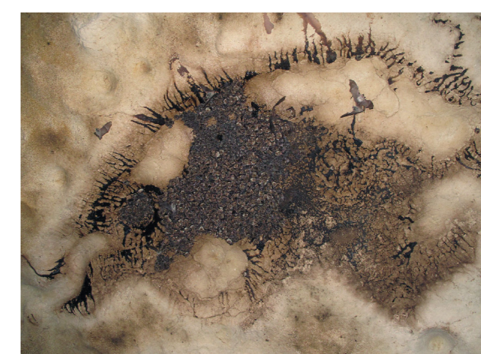
Colonia estiva di riproduzione

Elaborati: Sezione Trasversale, Sezione Longitudinale, Planimetria Scala 1:500