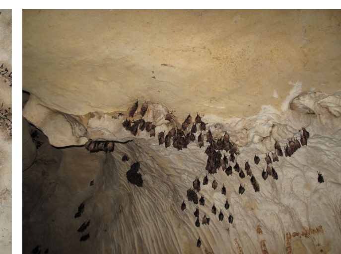
Colonia di letargo invernale