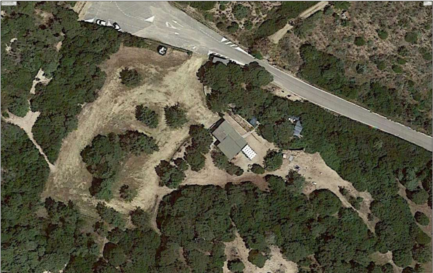
Ortofoto Satellitare Rilievo Floristico