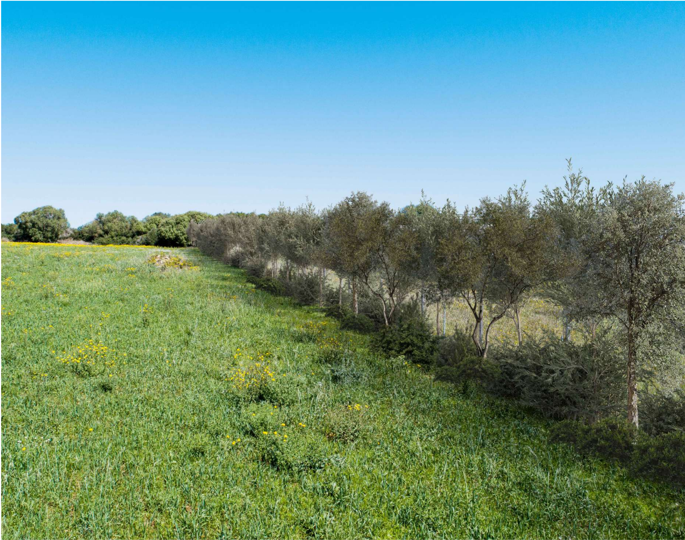
FOTOINSERIMENTO PUNTO VISTA CON MITIGAZIONE IMPATTO VISIVO