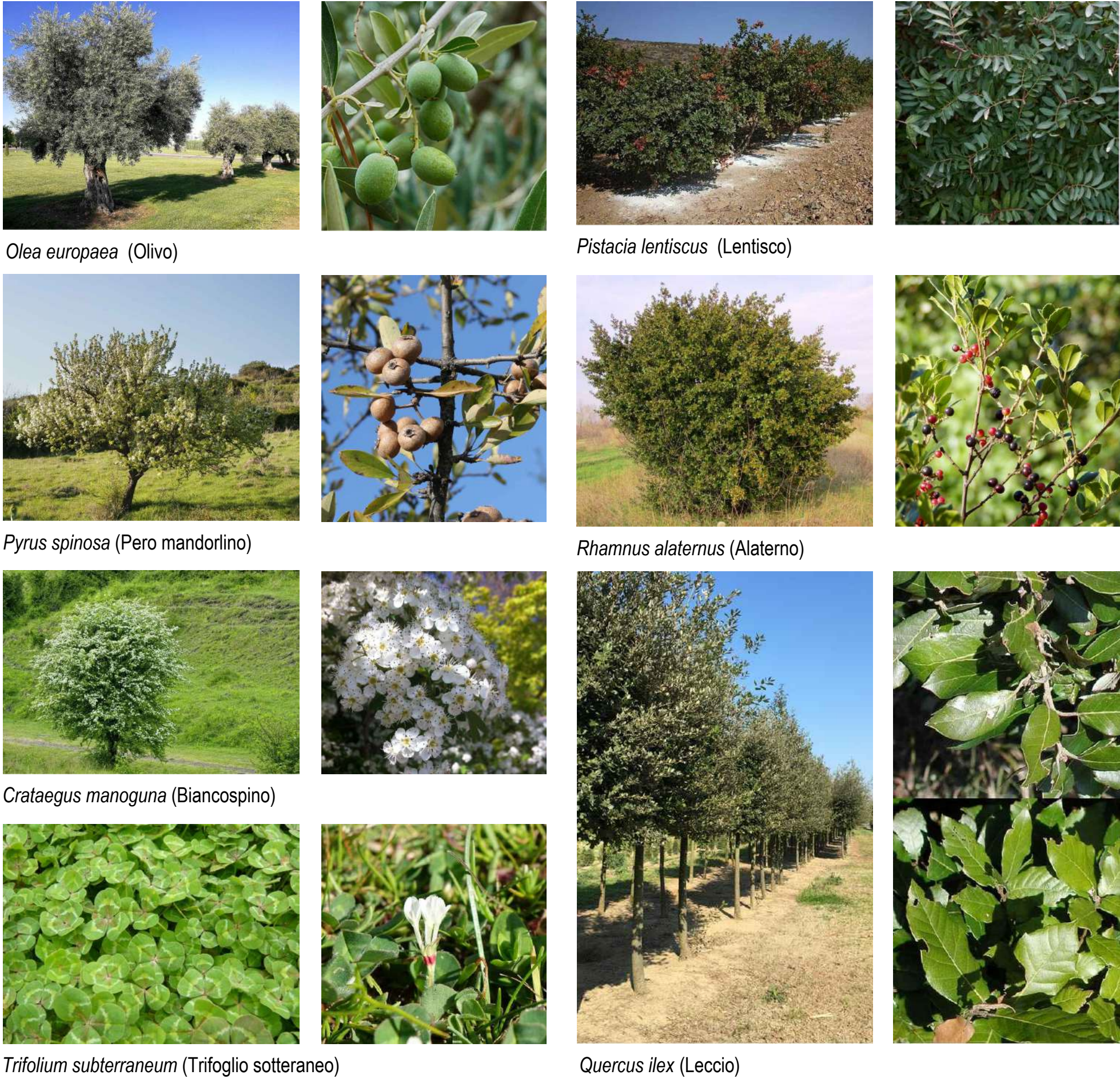
ABACO DELLE SPECIE ARBOREE