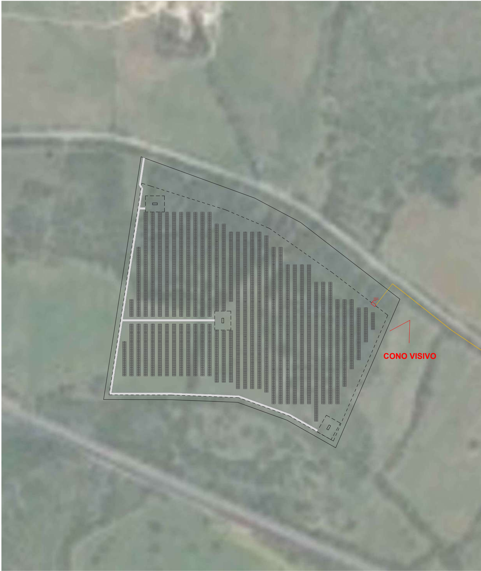
INQUADRAMENTO CON PUNTO DI VISTA