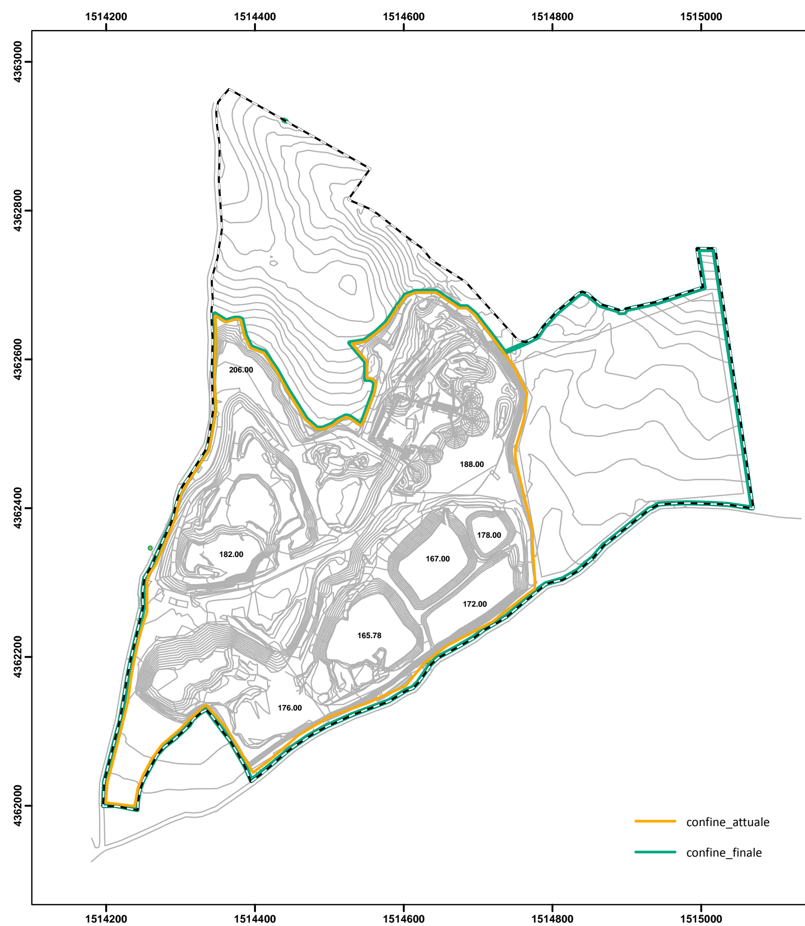
Stato Attuale scala 1:5000