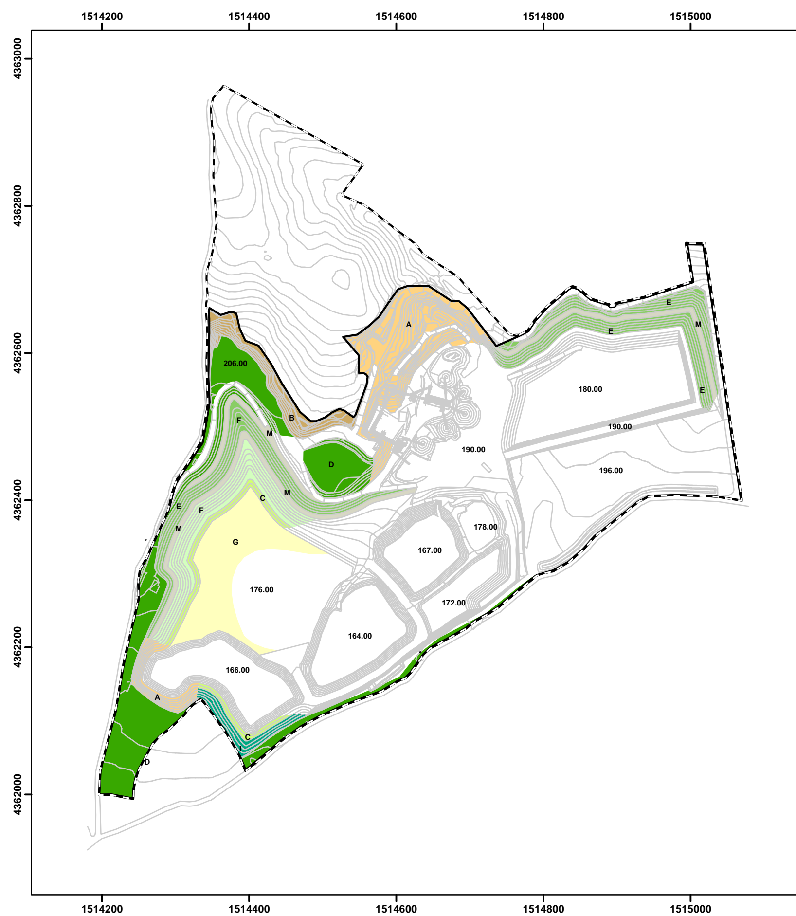
Stato Intermedio scala 1:5000