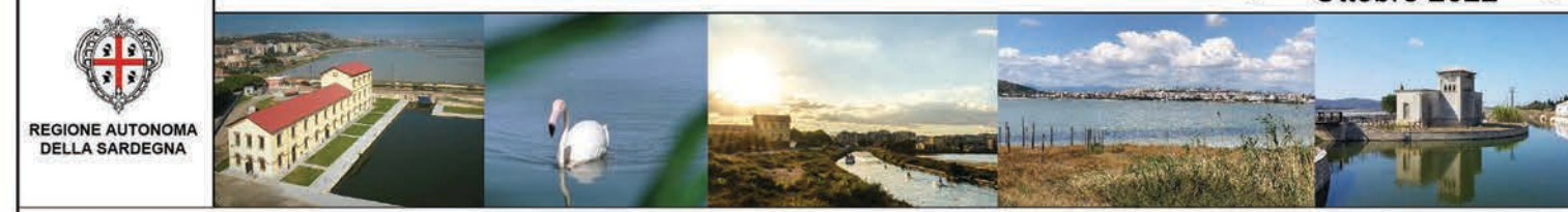
Tavola 19 - Ottobre 2022 -

oggetto: DISTRIBUZIONE AVIFAUNA (allegato I Direttiva 2009_147_CEE)