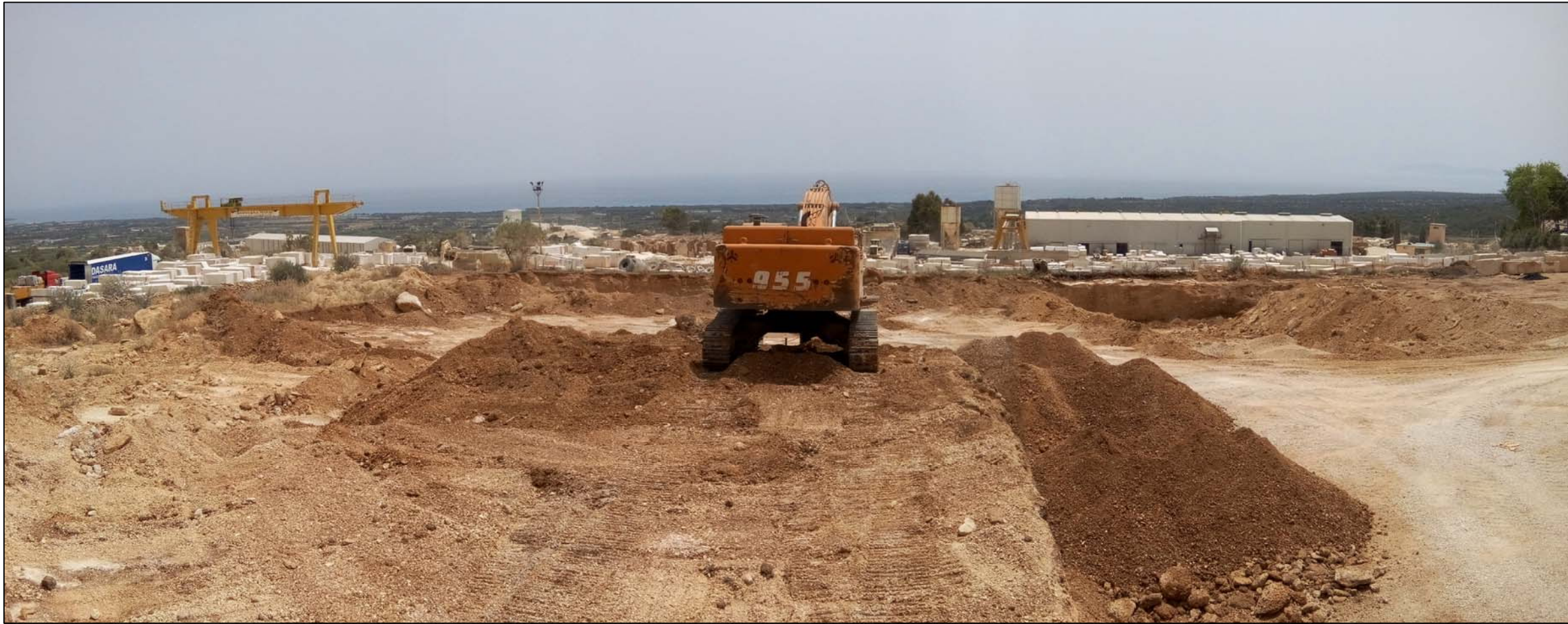
PUNTO DI VISTA N°3