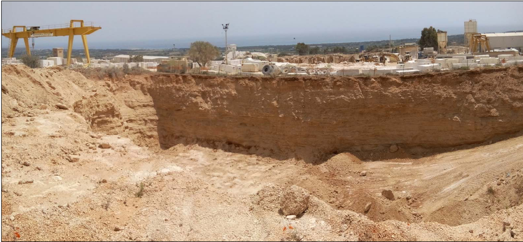
PUNTO DI VISTA N°6