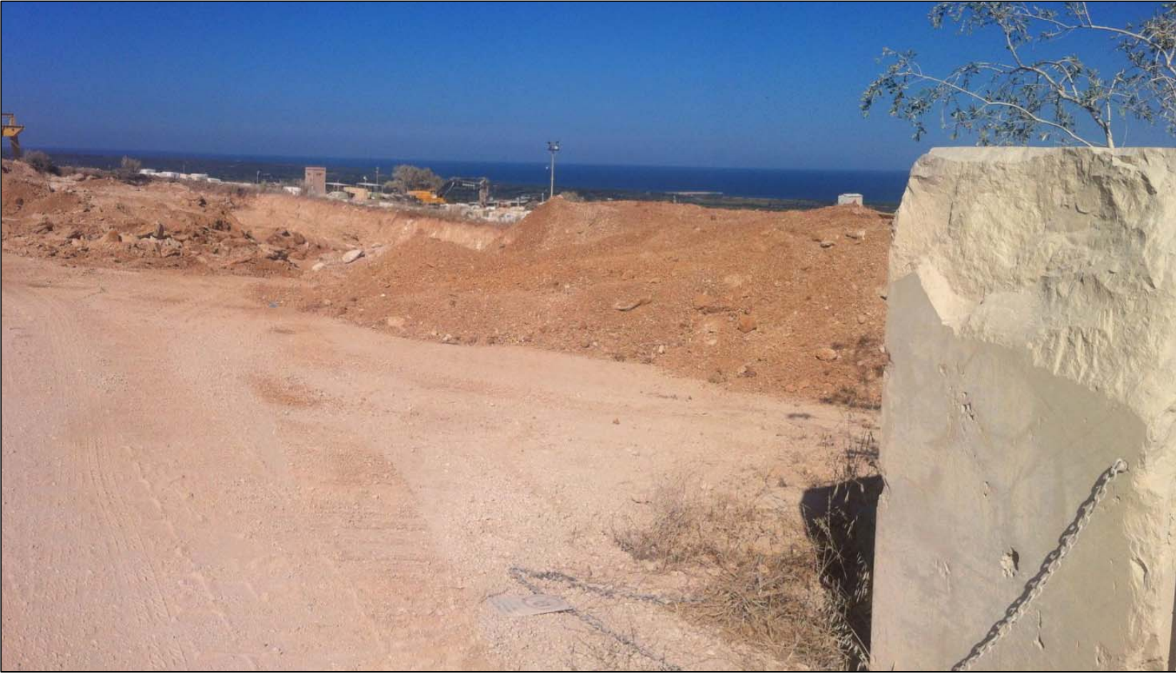
PUNTO DI VISTA N°4