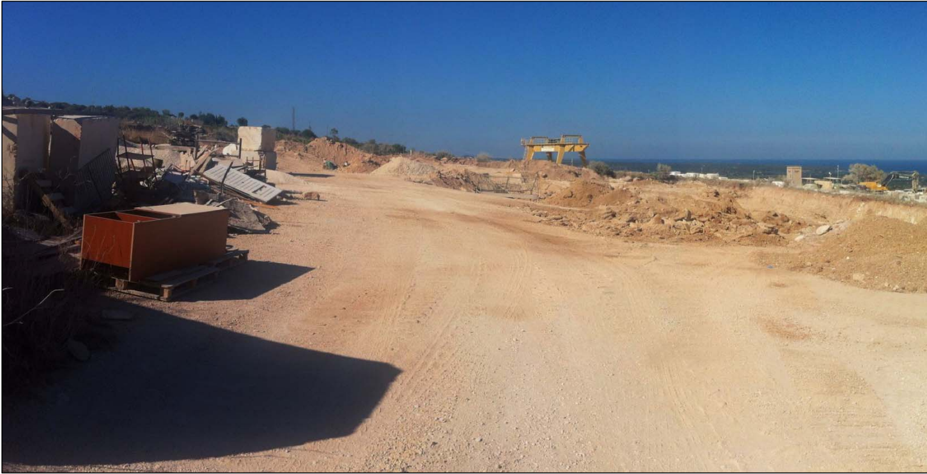
PUNTO DI VISTA N°5