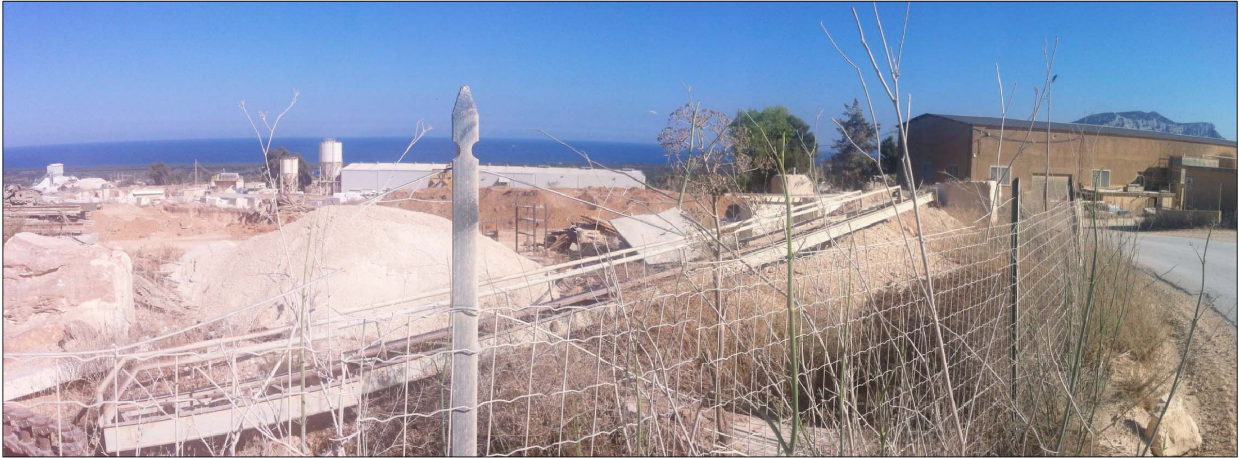
PUNTO DI VISTA N°2