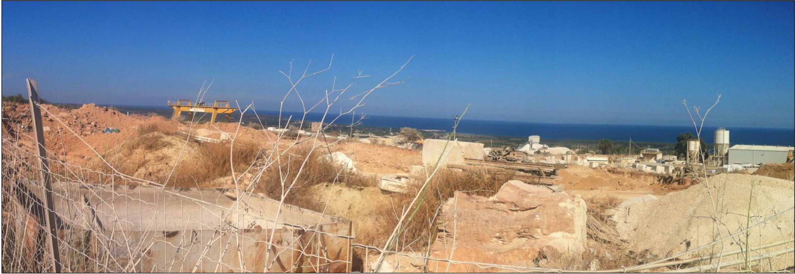
PUNTO DI VISTA N°1